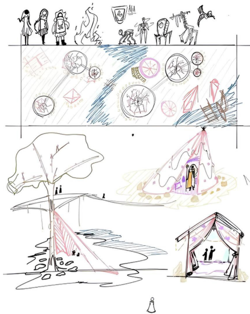
Figura 3 –Croquis das primeiras ideias sugeridas