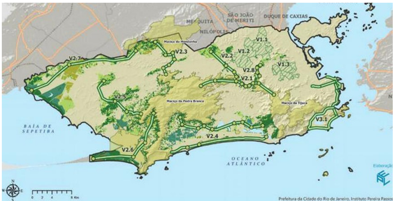
Figura 1 – Mapa dos corredores verdes implementados no Rio de Janeiro (cidade)

Como medida de solução para as desafiadoras ocorrências citadas, ampliando assim a resiliência urbana, foi proposto a inserção de 45 Corredores Verdes (figura 1) como o eixo principal do Plano de Desenvolvimento Sustentável (PDS), "definidos como áreas prioritárias para ampliação de infraestruturas verdes por meio de ações de reflorestamento, arborização urbana, criação, proteção e conexão de unidades de conservação, estímulo à manutenção e ampliação de áreas agrícolas, bem como áreas verdes de relevante interesse paisagístico e histórico, com vistas a sua adequada manutenção e conservação" (RIO CIDADE, 2020).