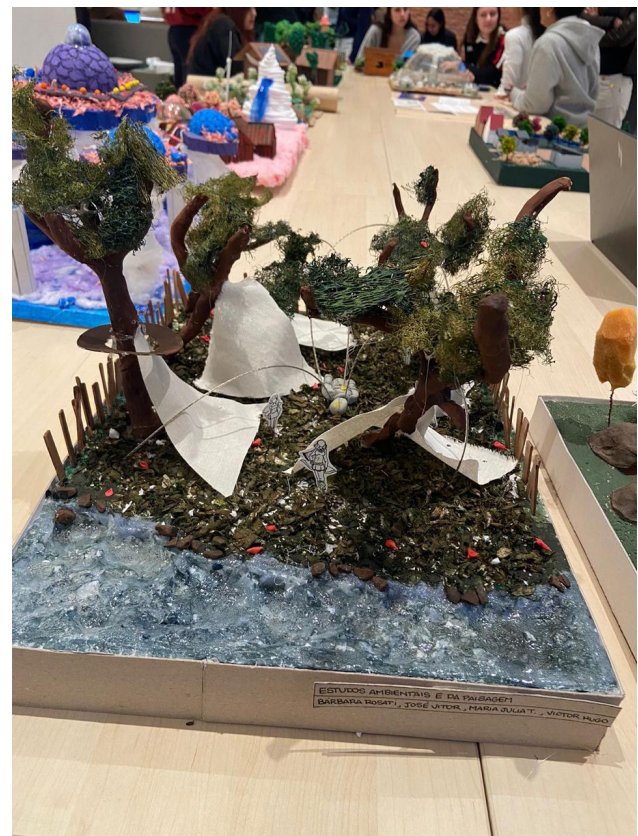
Figura 5 – Maquete da comunidade

A figura 5 mostra a maquete com a comunidade desenvolvida pela equipe, com os abrigos que usavam as árvores como pilares de sustentação, as plataformas de defesa e no centro o robô utilizado para abastecer a comunidade com energia.